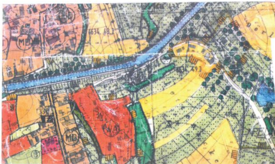
Bild FNP (Schwarzenbach) verwendet in Grundstück-, Bau- und Werkausschusssitzung vom 09.06.2021