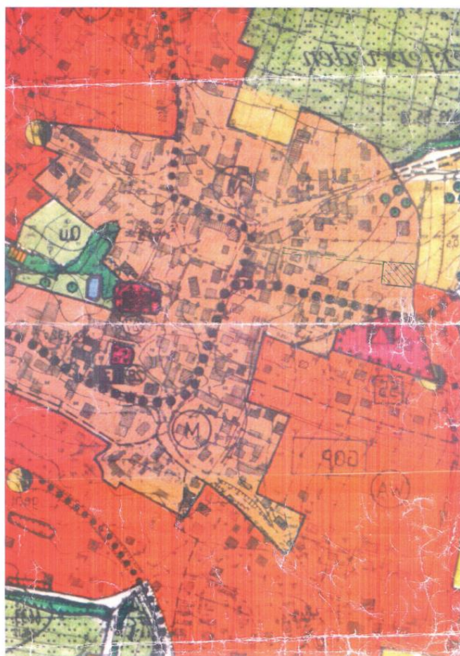
Bild FNP (Unterferrieden) verwendet in Grundstück-, Bau- und Werkausschusssitzung vom 08.04.2021